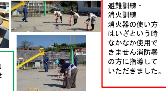
避難訓練・消火訓練 消火器の使い方はいざという時なかなか使用できません消防署の方に指導していただきました。