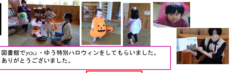
図書館でyou・ゆう特別ハロウィンをしてもらいました。ありがとうございました。