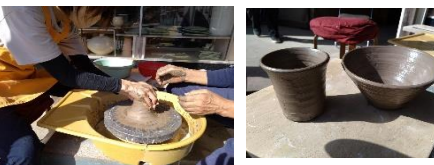
日吉アートめぐりをしました。楽しかったです。来年はもっと計画的に回りたいと思います。ぜひ、皆さんもまわりませんか？