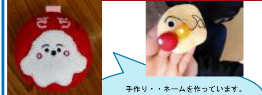
手作り・・ネームを作っています。お子さんのご機嫌な時に少しずつ。一緒に作りましょう！！