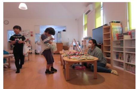
どこ行こうかな〜。何買おうかな〜♪