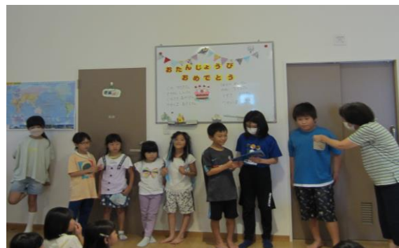
8月生まれのお友達を紹介