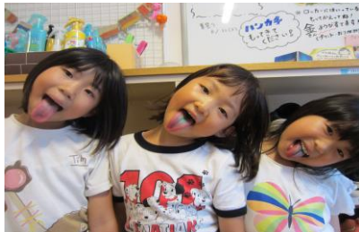
あっかんべー。かき氷で舌の色が...