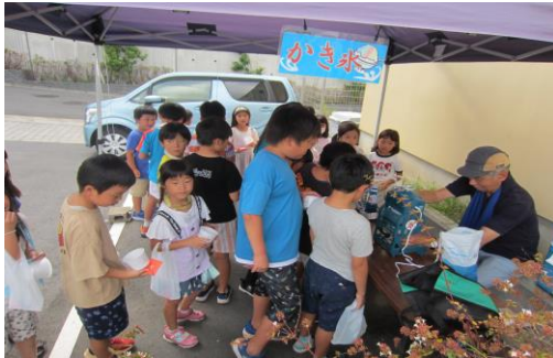
外ではかき氷やさん。大繁盛！