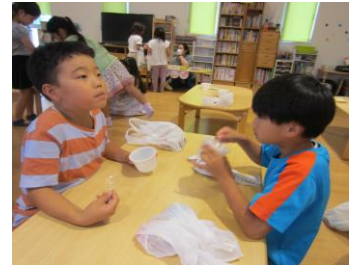
さ、寒くなってきた...