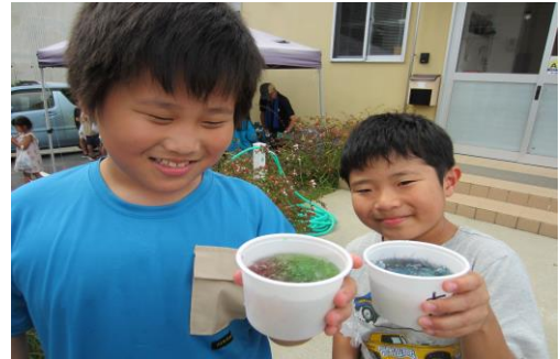
レインボー?! シロップかけ放題