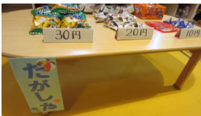
室内では3か所の駄菓子屋さん