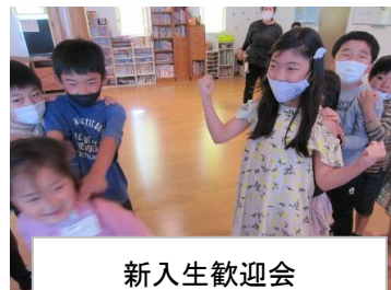
新入生歓迎会 みんなで列車