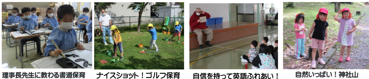
理事長先生に教わる書道保育 ナイスショット！ゴルフ保育 自信を持って英語ふれあい！ 自然いっぱい！神社山