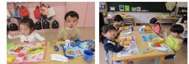
※ランチの目的は好き嫌いをなくすことです。