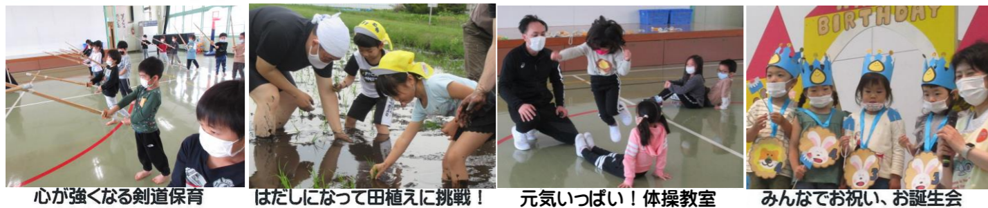
心が強くなる剣道保育 はだしになって田植えに挑戦！ 元気いっぱい！体操教室 みんなでお祝い、お誕生会