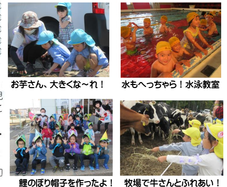
お芋さん、大きくな～れ！ 水もへつちやら！水泳教室