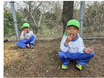
海が見える文化公園 野外ステージ