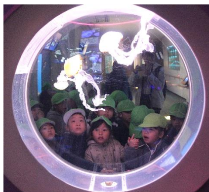
「クラゲきれいだね～☆」 「さされたら痛いんだよ！」