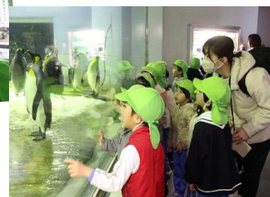
お掃除中のダイバーさんが バブルリングをしてくれました！