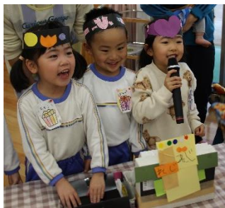
しじょうさんは元気に「いらっしゃいませー！」と声を掛けていました。