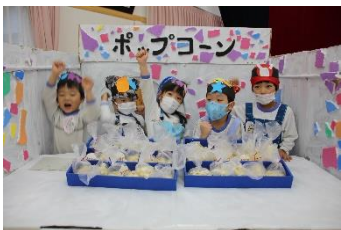
お店係さんは乳児組さんには先生たちにばら・さくら組さんには一人ずつ手渡ししました！