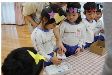
千ヶつやさんはお金を払ったお客さんに千ヶつを渡しました！