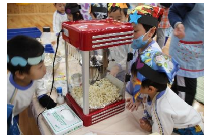
お客さんが来ない間は、お店のセティングをしなおしたりポップコーンの機械を眺めたりしていました！