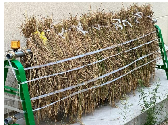
束ねて干しています！送迎の際は是非みて下さい！