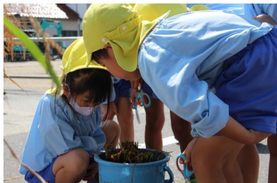
切ったところの観察もしていました！