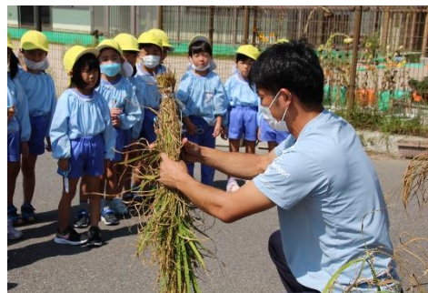
こうやって束ねて干すよ！