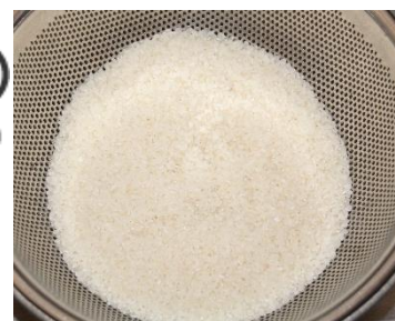
精米したお米！ 白くてピカピカでした！