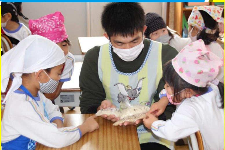
「玄米」「こしひかり」「きぬむすめ」を比べてみました！ どこがちがうのかな～？

さくら組さんが園で育てたお米を精米したり、お米とぎをしました！ おやつは、みんながといてくれたお米で“お楽しみおにぎり”にして食べました！