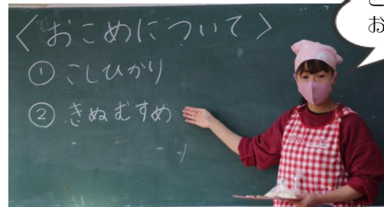
2つのお米の特徴などをまきました！