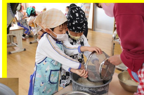
お当番さんが炊飯器にお米とお水を入れてくれました！