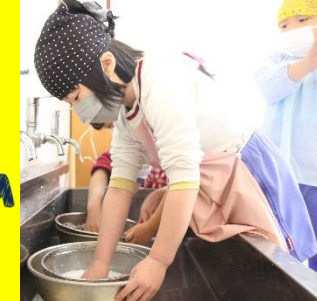
少しずつお米をとぎました！