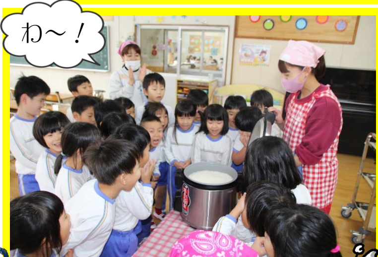
楽しみにしていた、ご飯が炊けました！