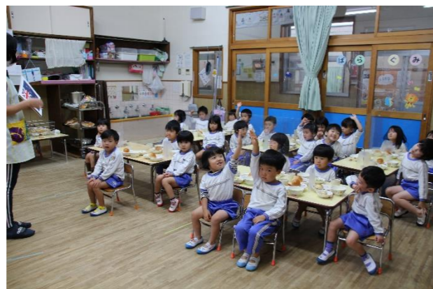
正解したお友だちが沢山いました！