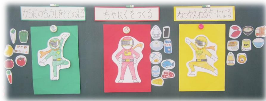
戦隊シンジヤーでみんな集中力もUPでした！