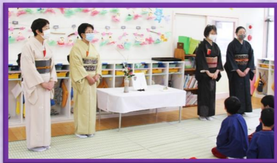
本日も寒い中、4名の先生にお越しいただきました