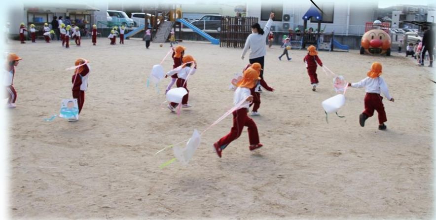
外でもとばしてみたよ！