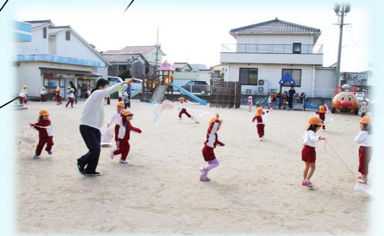
「手を上にあげてごらん♪」のアドバイスで上手にみんなとばしていました！