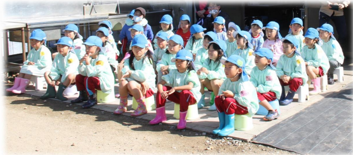
現地でのお話を聞く姿勢も養護学校の先生に褒められました。 みんな真剣な表情☆