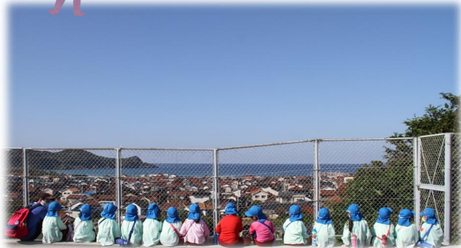
感染症対策で2便に分かれて行ったので待ち時間に日本海を眺めていたひまわりぐみさんでした♡