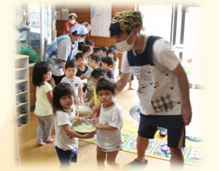
結局、全員で持って行きました♪