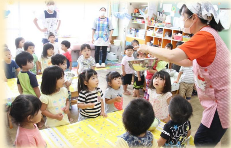
正木先生から、ちぎる大きさなどお話を聞きました♪