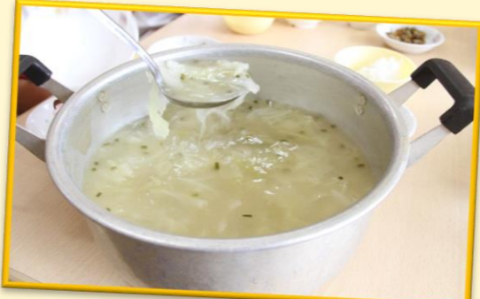
給食先生が美味しくお味噌汁にしてくれました♡