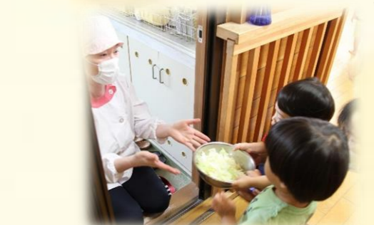
一つひとつ給食先生が受け取ってくれました☆