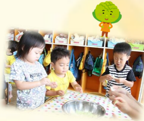
早くキャベツをちぎりたくて、うずうずしていたすみれぐみさん☆