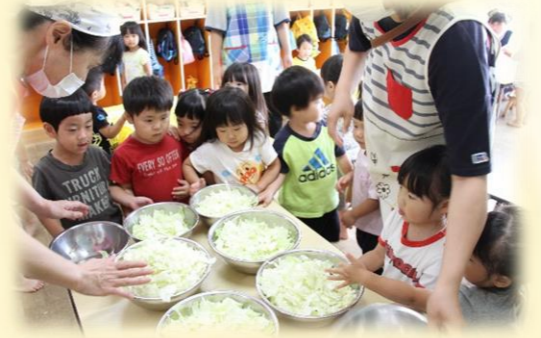
「ぼくが給食室にもっていく!」「わたしが持っていくもん!」とキャベツに殺到中(笑)