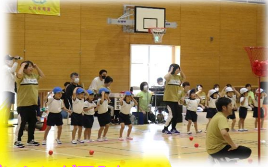
「ダンシング玉入れ」 チェッチェッコリ〜♪