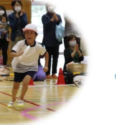
リレー 3クラスでバトンをつなぎました！