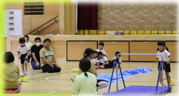
かもめ組 保育園周りの風景に見立てた 運動機器を 次々にこなして おうちの方とゴールしました！