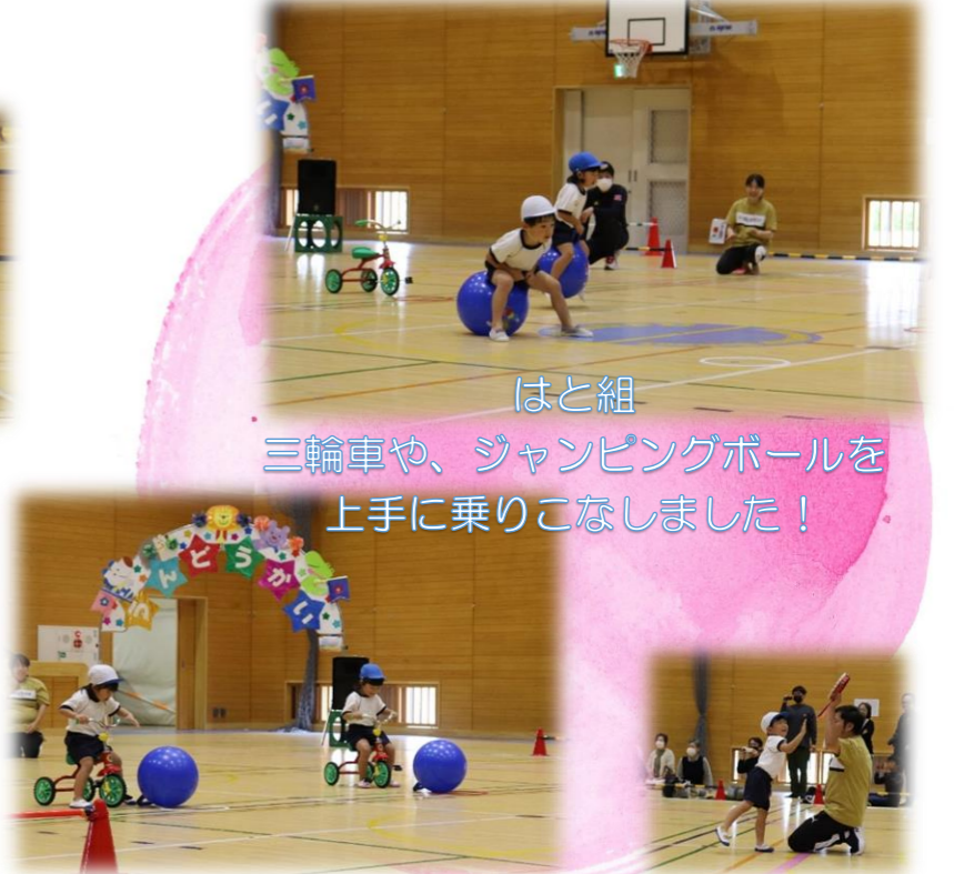
はと組 三輪車や、ジャンピングボールを 上手に乗りこなしました！