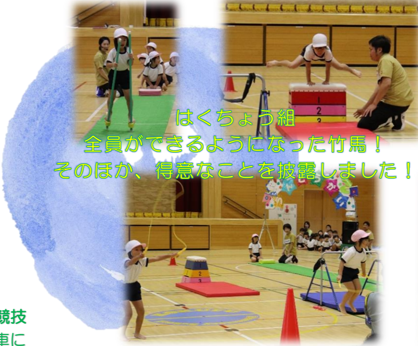
はくちょう組 全員ができるようになった竹馬！ そのほか、得意なことを披露しました！