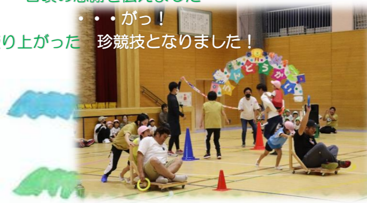
…がっ！ 盛り上がった 珍競技となりました！