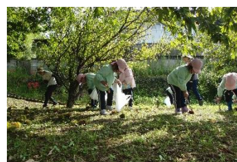
栗拾いに行ったよ☆