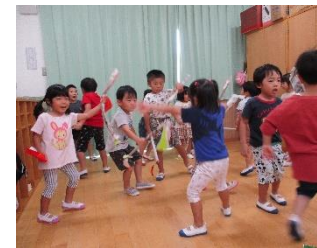
盛り上がった神楽ごっこ