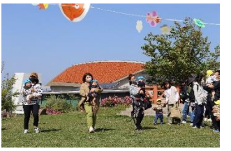
笑顔いっぱい家族遠足☆