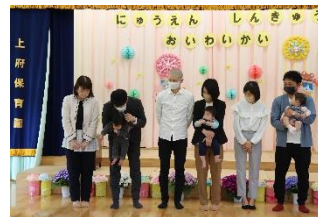
入園式・進級お祝い会をしました