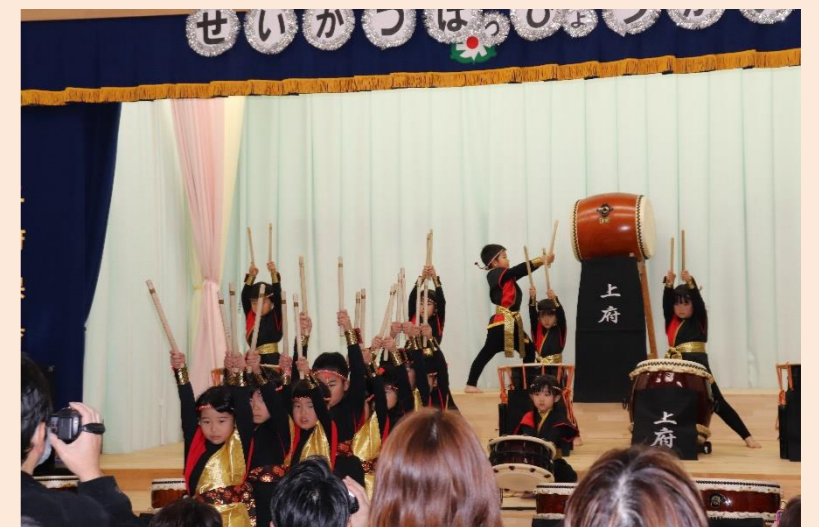
一年を通して頑張ってきた和太鼓。 みんなと奏でた 素晴らしい発表になったね!