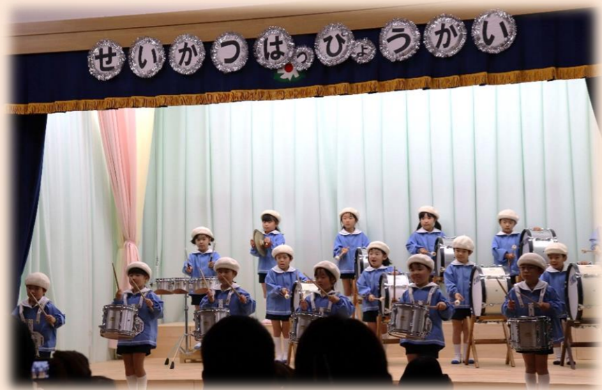
初めて使う楽器。発表会にむけて 頑張って練習したね☆