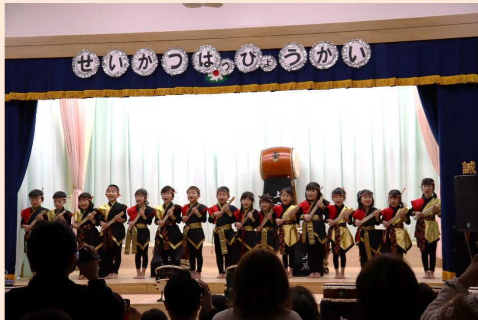
やりきった表情が とてもカッコよかったよ!