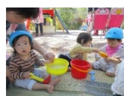
いろいろな活動を楽しんでいます！