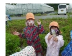
地域の方と畑の植ええやヨモギ採りをしました！