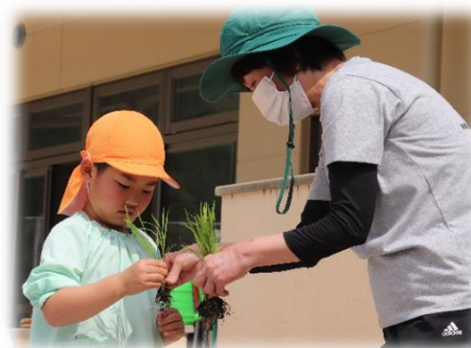
苗を一本ずつ くぐーっと 植えたよ♪