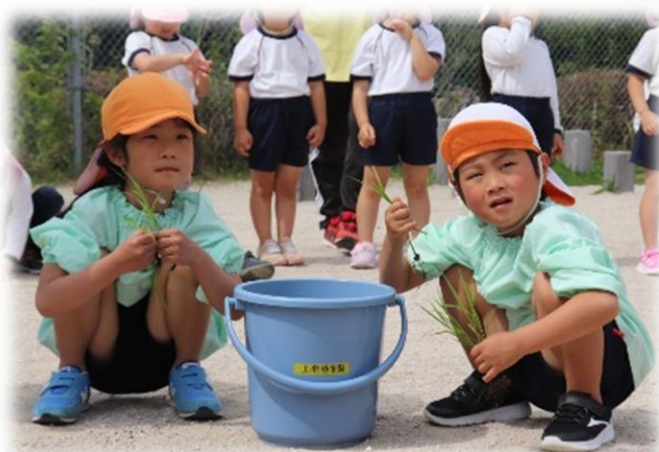
さぁ！植えてみよう！