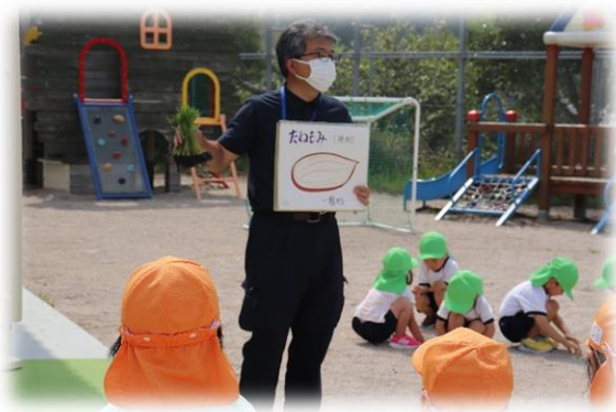
JAの方に来ていただき 「お米の一生」の話を聞きました