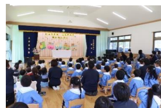
入園・進級お祝い会をしました。