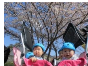
新しいクラスにも慣れてきて、お外では春を感じています！