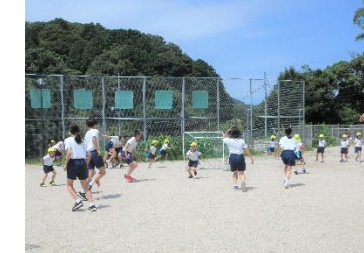
東中学校生との交流