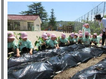
園の畑にも植えました!