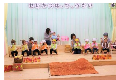
生活発表会 (すすめ組)