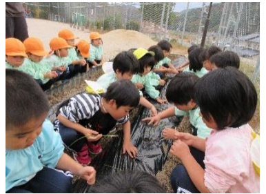
玉ねぎの苗を植えました (幼児組)