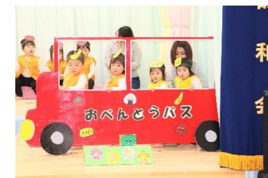
生活発表会 (ひばり組)