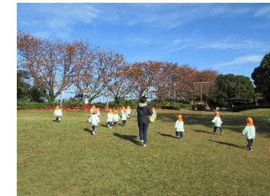
ゆうひパークの公園であそびました! (幼児組)