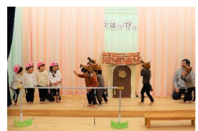
生活発表会 (つばめ組)