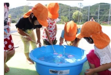
ヨーヨーつりをしました