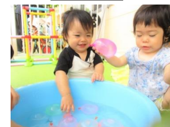
水風船で遊びました