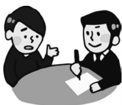
介護のことで相談したい