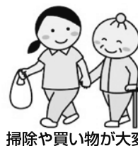
掃除や買い物が大変だ