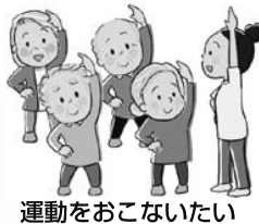
運動をおこないたい