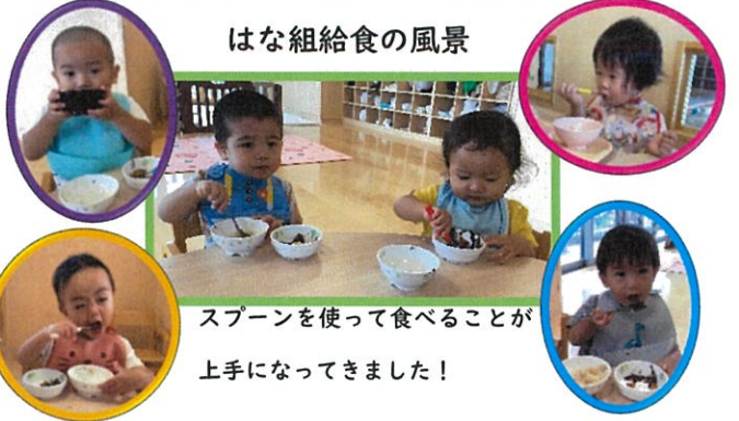
はな組給食の風景