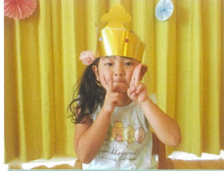
8がつ1にち 生まれ ♡♡♡ちゃん 4さい