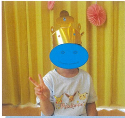
8がつ11にち 生まれ ☆☆☆くん 5さい