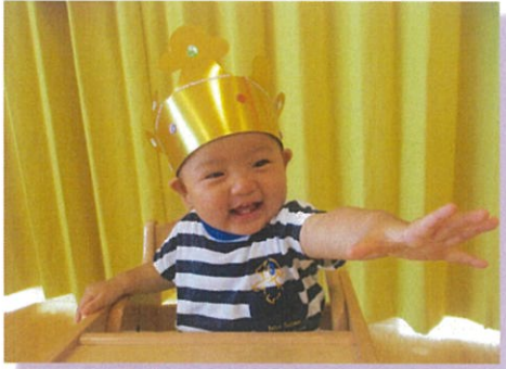
8がつ24にち 生まれ ☆☆☆くん 1さい