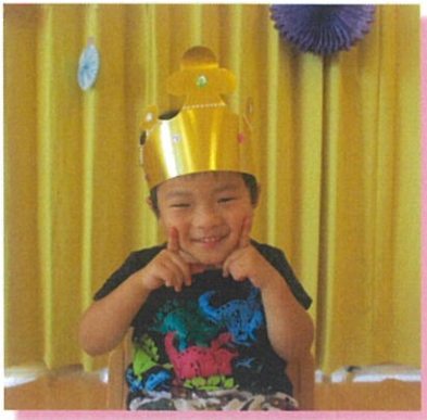
8がつ21にち 生まれ ☆☆☆くん 4さい