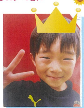
8がつ30にち 生まれ ☆☆☆くん 5さい