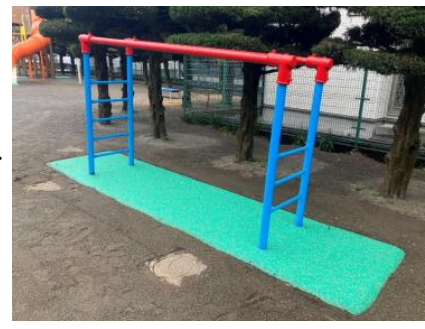
うんてい下, 施行後