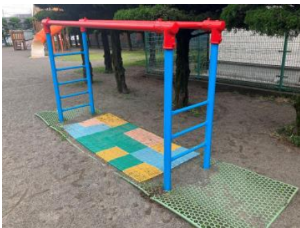
うんてい下, 施行前