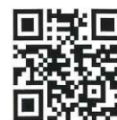
かなざわ保育ナビ