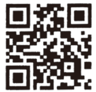
かなざわ保育ナビ