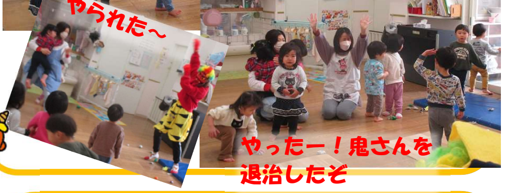
やったー！鬼さんを退治したぞ