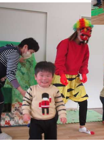
先生～、こわかったよ～と、抱きしめてもらいます。