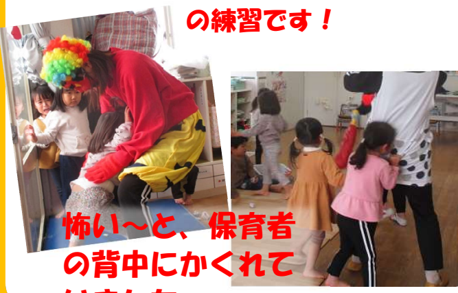
怖い～と、保育者の背中にかくれていました