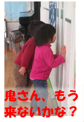
鬼さん、もう来ないかな？