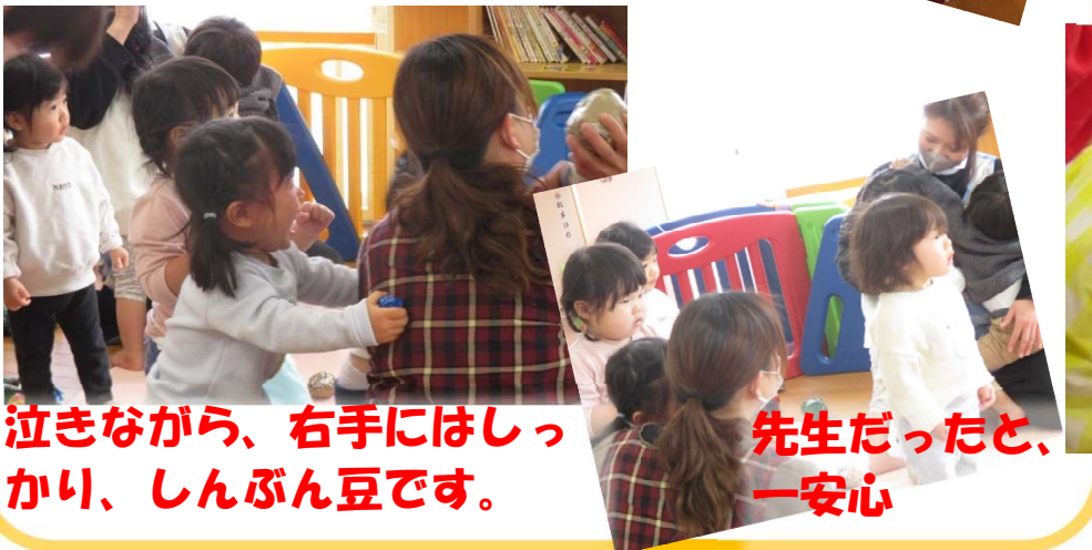
泣きながら、右手にはしっかり、しんぶん豆です。