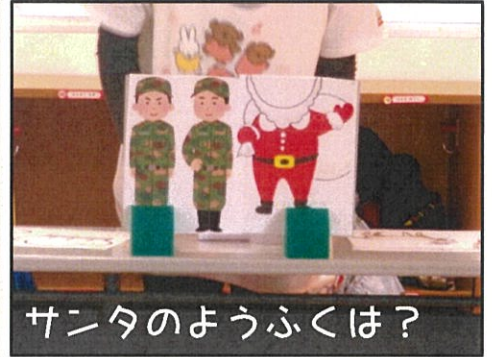
サンタのようふくは？