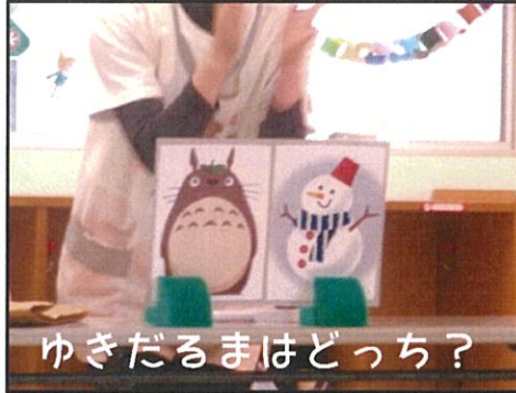
ゆきだるまはどっち？