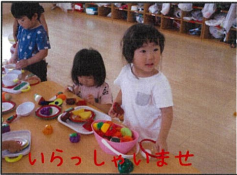
いらっしやいませ