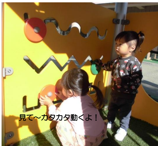
見て～カタカタ動くよ！