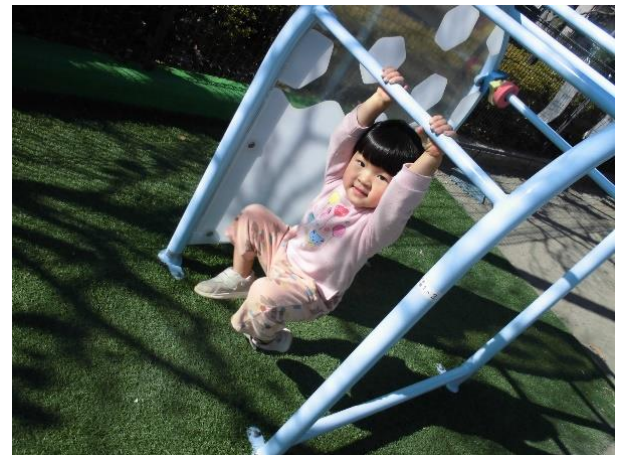
うんていにぶら下がって ぶ～らん ぶ～らん。「揺れてるよ！」