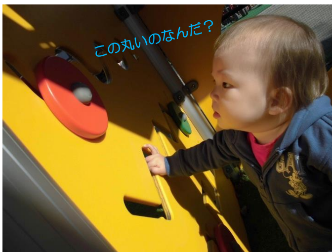
この丸いのなんだ？