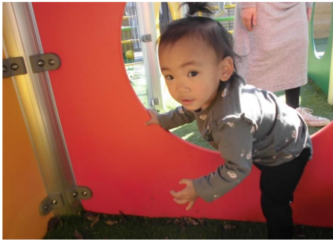
「よいしょ！よいしょ！！」 通り抜けパネルは小さな子どもたち も大好き♡