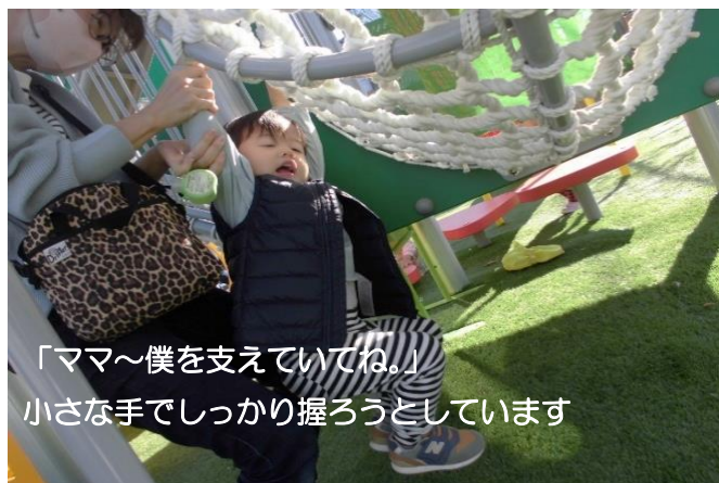
「ママ～僕を支えていてね。」 小さな手でしっかり握ろうとしています