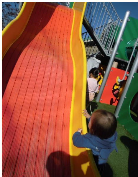
「やってみたいなあ・・・」 大きな波々の滑り台は大迫力！