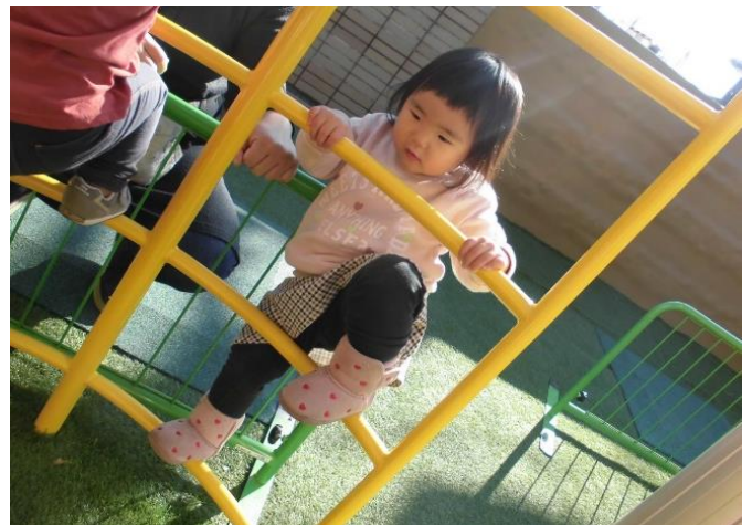
「登ってみよう！」 ママに見守られて、もぐり登りに挑戦。 バーを掴んでやる気満々です。

こちらは乳児用の遊具です。小型のローラー滑り台、太鼓橋、うんていは子どもたちの体の発達にあわせて構造になっているので、0歳児から2歳児までが毎日楽しく遊んでいます。