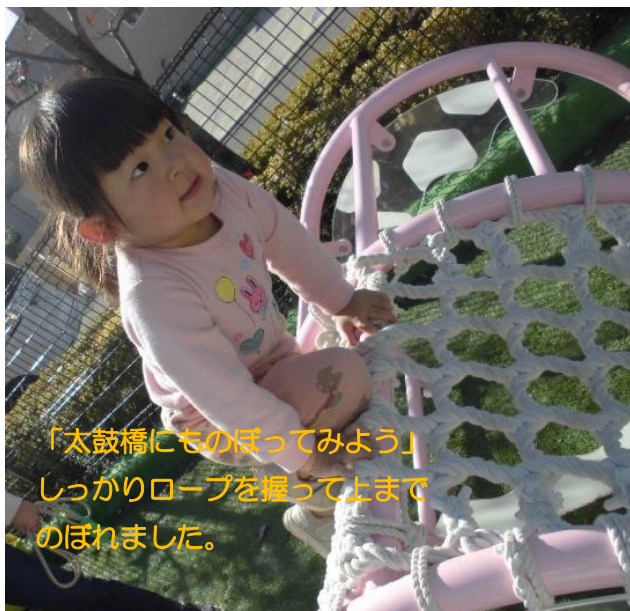
「太鼓橋にものぼってみよう」 しっかりロープを握って上まで のぼれました。