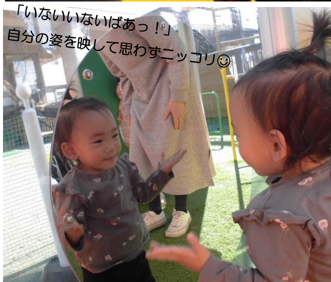
「いないいないばあっ！」 自分の姿を映して思わずニッコリ😊