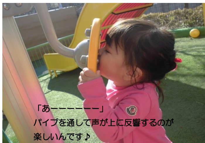
「あ—————」 パイプを通して声が上に反響するのが 楽しいんです♪