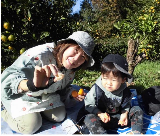
先生も一緒にいただきます