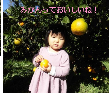
みかんっておいしいね!