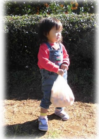
ママ~みかん重いよ~~