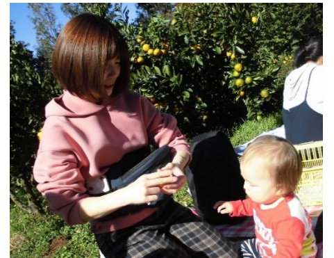
富士山🗻がよく見えました🐰