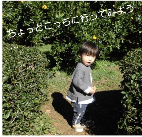
ちょっとこっちに行ってみよう