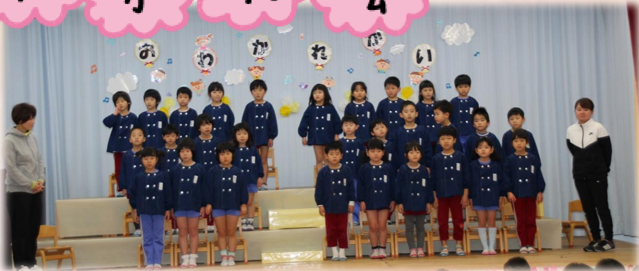
入場後、ちょっぴり緊張気味ですがお兄さんお姉さんらしい立ち姿☆