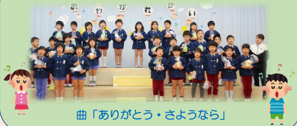
曲「ありがとう・さようなら」