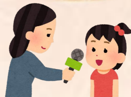
「大きくなったら～になりたい です！」とハキハキとマイク を自分たちで回しながら発表 できました☆