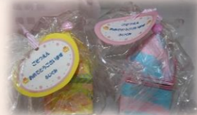
可愛い小物入れ☆ 何か入れて使ってね♡