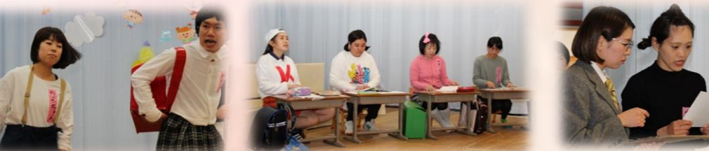
毎日元気に学校で過ごす事に必要なこと☆ 「はやね！はやおき！あさごはん！」