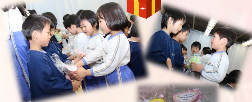
ふじぐみさんから 心のこもった手作り プレゼントをもらい ました♪