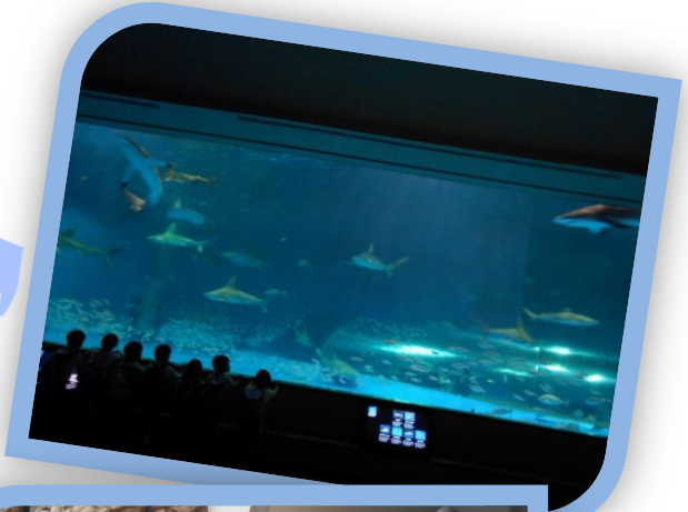
アクアス 見学出発!