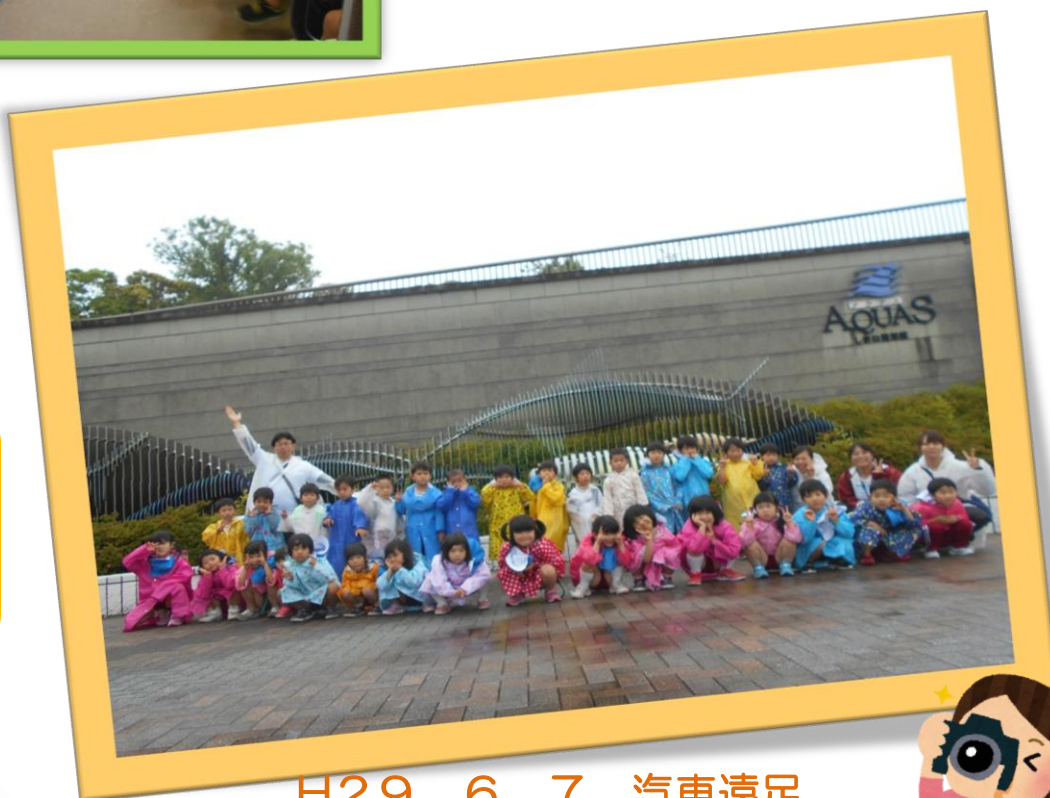
H29. 6. 7 汽車遠足 浜田駅→波子駅→アクアス