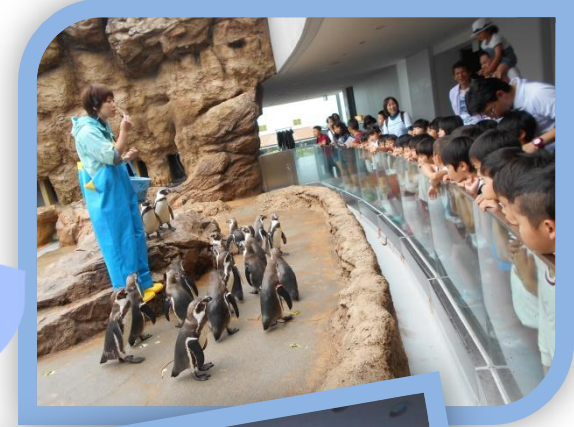
ペンギン のお食事