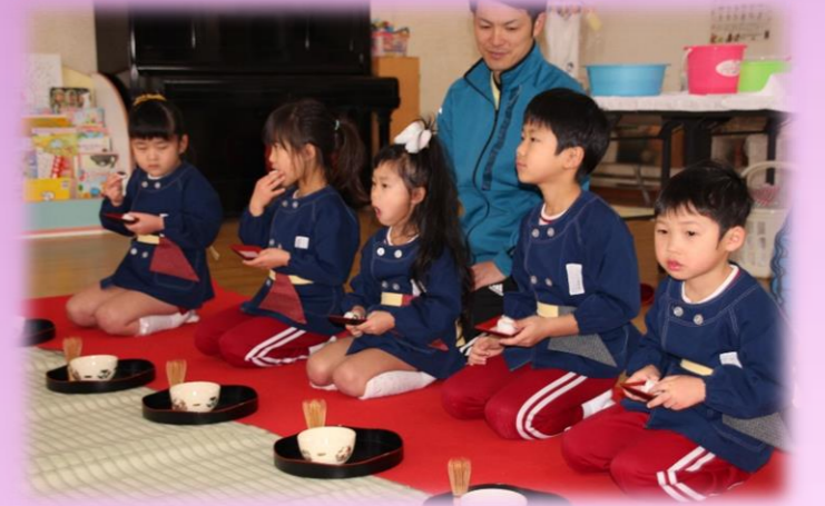
本日のお茶菓子は「浜っ子まんじゅう」