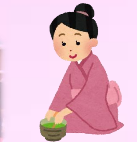
この度は自分でお茶を点てました