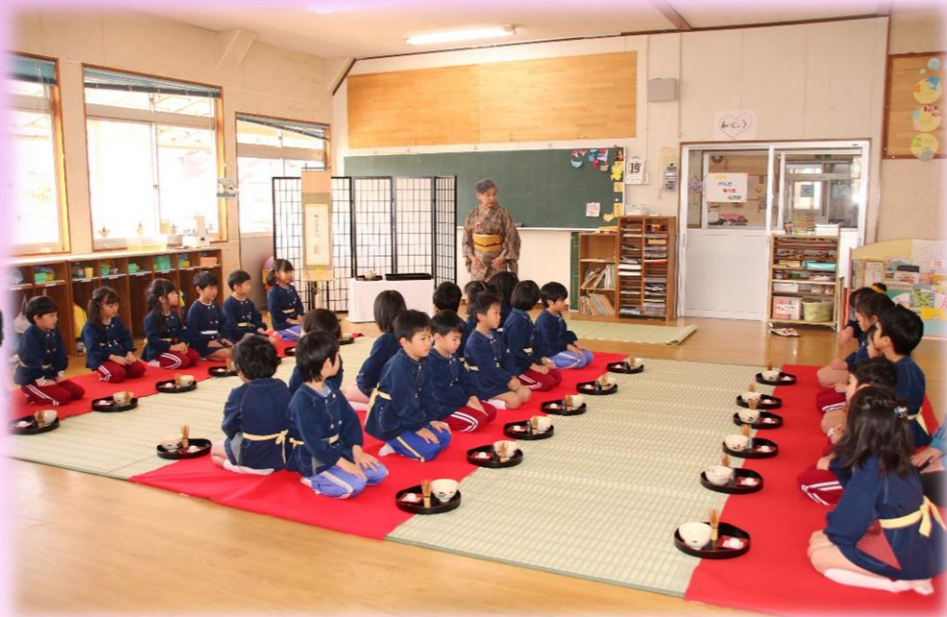
とても姿勢良く、1回目の作法を覚えて上手にお運びを実践していました☆

2回のお茶会を終了し「おしるし」をいただきました。一人ずつみんなの感想を尋ねると「お茶を混ぜるのが楽しかった」「この前はお茶が苦かったけど今日は苦くなかった」「お茶を教えてくださいありがとうございます」等々、考えをまとめながらお茶の先生方の前で発表できました。良い経験になりました 🍵