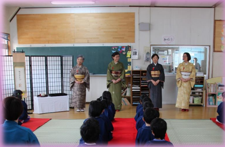
4名の先生に来ていただき、お茶の作法 (盆点て) を教えて頂きました