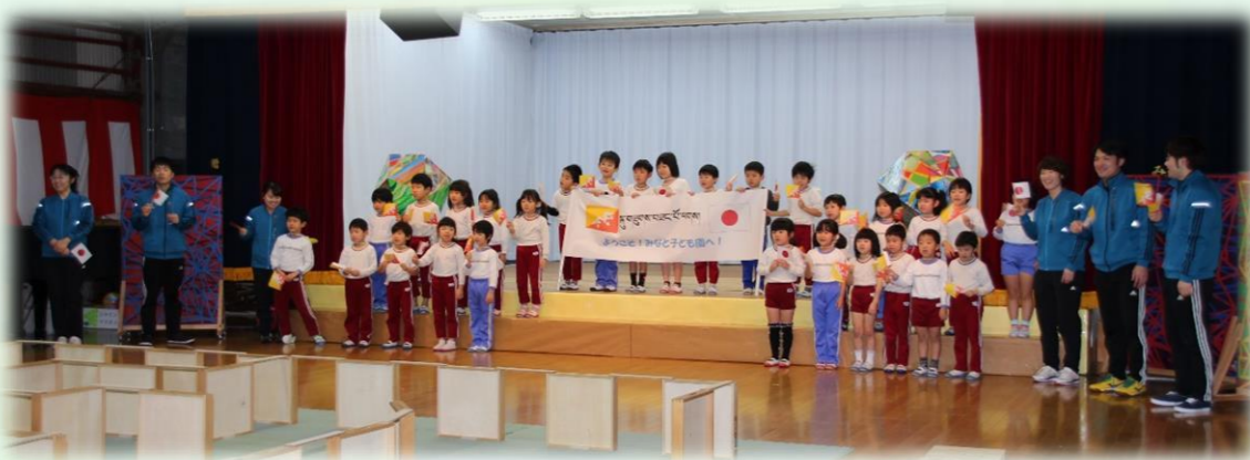
【クズザンポーラ！（Kuzuzanpo la!）】（こんにちは！） ゾンカ語も覚えて大きな声でお出迎えしました♪

異文化交流を通して、子どもたちなりに言語や服装の違いなどを知り、言葉が通じなくても遊びを通して交流を深められたことは良い思い出になりました☆