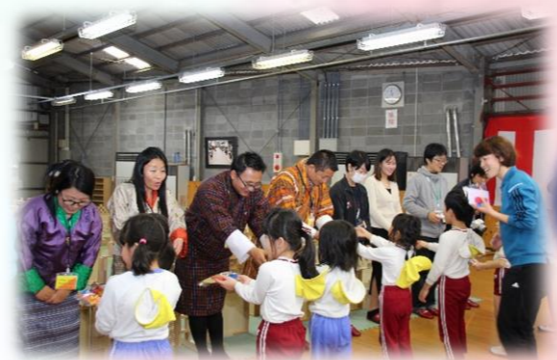
折り紙で「鶴」と「富士山」を子どもたちが折りプレゼントしました☆