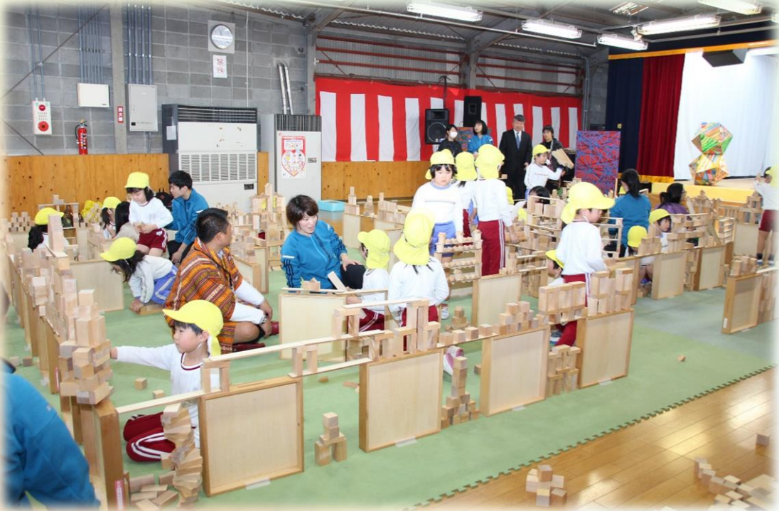
ブータン王国の方と積極的に関わり一緒に迷路作りを楽しみました。遊びに国境は無いようです♪