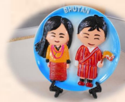
ブータン王国の民族衣装を着たお人形の置き物を頂きました♡