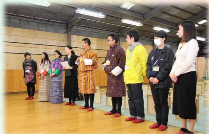
ブータン王国の方達の他、子ども美術館・通訳の方も一緒に来られました