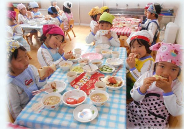
これならお野菜も食べれるね！