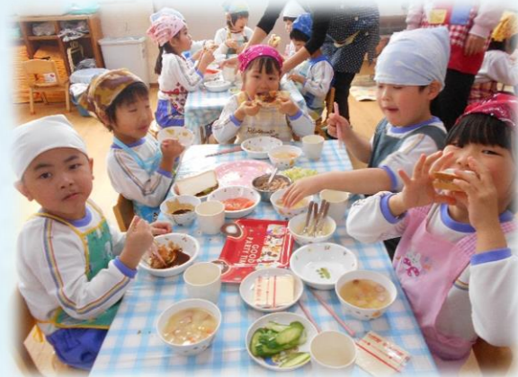
いっぱいはさんだよ！