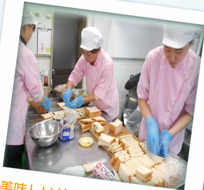
美味しいサンドイッチ作るぞ！