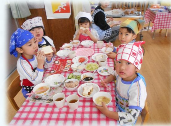
次は何をはさもうかなあ・・・