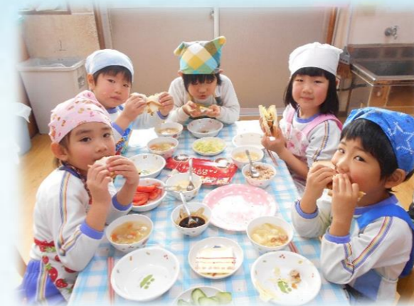
みてみて！もりもりサンドイッチ♪