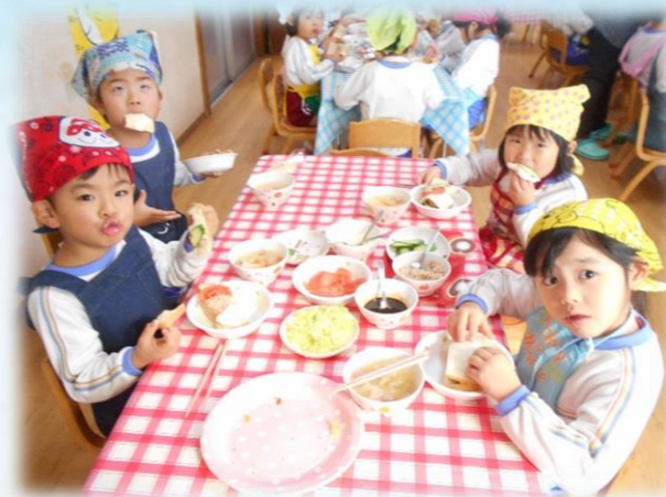
明日もサンドイッチがいいなあ・・・