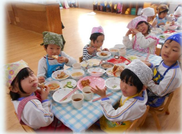
沢山たべれちゃうね☆