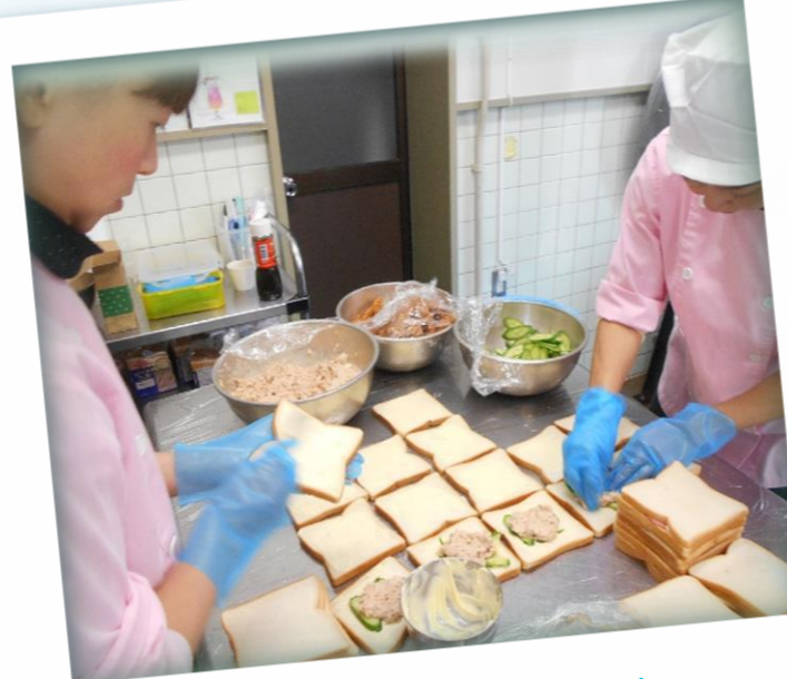
喜んで食べてくれるかなあ・・・