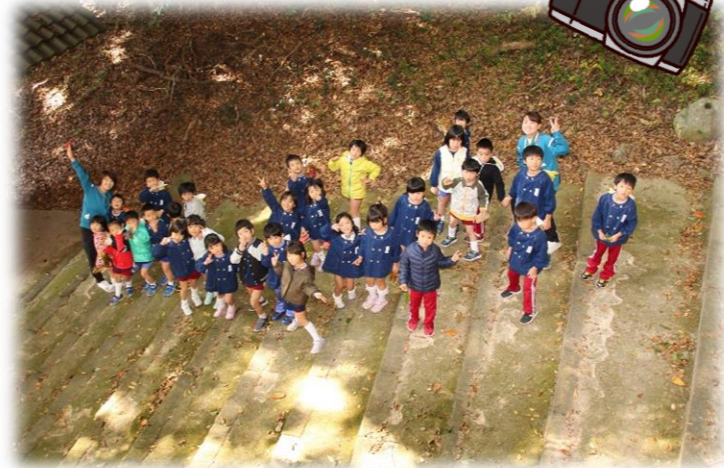
上から「ハイ！チーズ！」