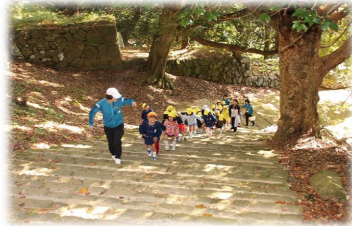
急な階段も頑張って上がりました♪