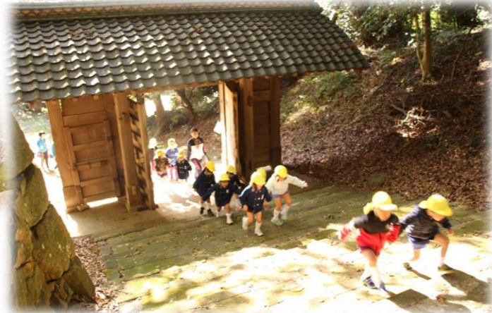
さあ！ 浜田城跡地の探検だ！