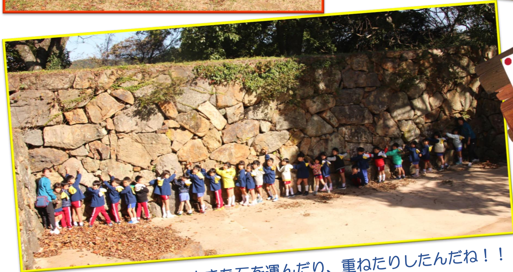
昔の人たちは、こんなに大きな石を運んだり、重ねたりしたんだね！！