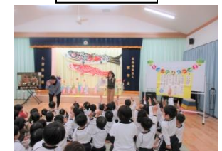
こどもの日のつどい