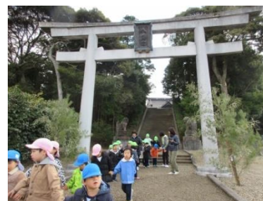
上府八幡宮へ初詣にいきました。