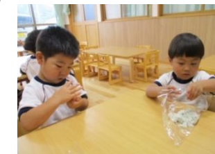
らんらんランチ～おにぎりを作って、みんなで遊戯室で食べました!