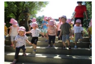
お散歩で神社へ行きました。