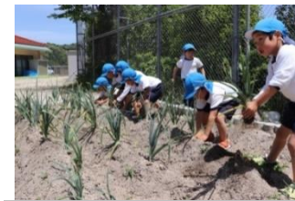
玉ねぎの収穫をしました!