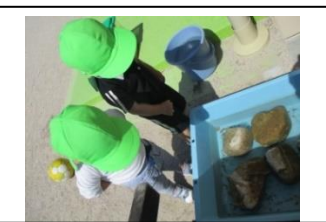
おたまじゃくしの観察中◎