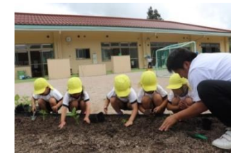
夏野菜の苗を植えました。