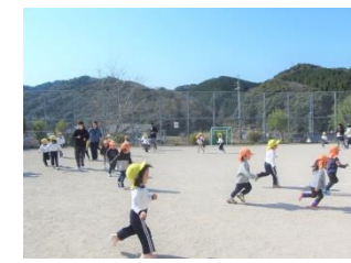
体力作りに、みんなでマラソンをしています！