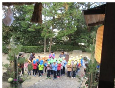
上府八幡宮へ初詣